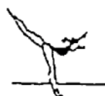
Posição de equilíbrio (5%)