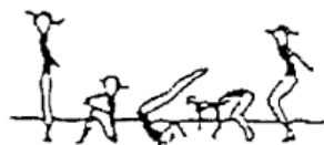
Rolamento à retaguarda (10%)