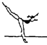
Posição de equilíbrio (5%)