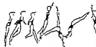
Salto de mãos à frente (10%)