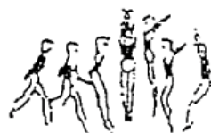
Corrida e salto em extensão com 1/2 volta (5%)