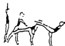
Posição de equilíbrio (avião, bandeira, etc.) (5%)