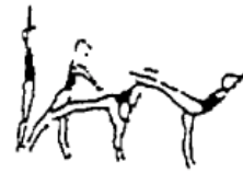
Posição de equilíbrio (avião, bandeira, etc.) (5%)