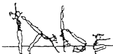
Apoio facial invertido, rolamento à frente (20%)

Construa uma sequência, com as diversas figuras, de forma a obter no mínimo 60 % de média do valor global dos elementos técnicos.